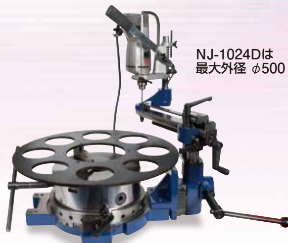
NJ-1024Dは 最大外径 φ500