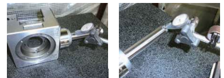
マグネット側の測定