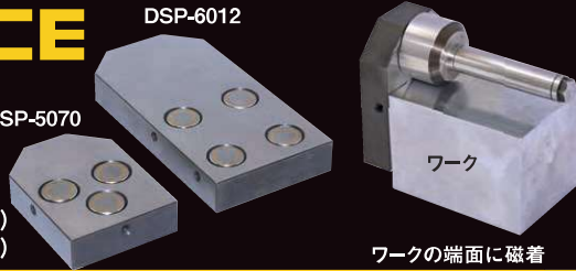
ワークの端面に磁着

DSP-5070→(HDC 80用.MG-3ヶ) DSP-6012→(HDC150用.MG-4ヶ)